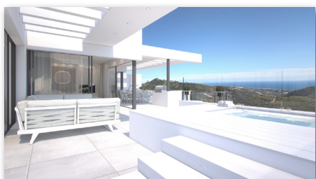
MARBELLA, VISIONÄRE LUXUSEINHEITEN IN STADTNÄHE - SPEKTAKULÄRE AUSSICHT! 2 - 3 SZ, 92 - 224 M 2 , BIS ZU 232 M 2 TERR. HEALTH CLUB! Ab € 800.000 ID 18511

NEUE SICHT AUF DIE DINGE! IM SINNE DER LEBENSQUALITÄT & DER AKTUELLEN LAGE, DASS VERFÜGBARKEIT ALLER ROHSTOFFE KEINE SELBSTVERSTÄNDLICHKEIT MEHR IST, PRÄSENTIERT IHNEN »RESIDENCIAS LUJOSAS VITALUX, S.L.« MIT BEWUSSTSEIN FÜR SORGFALT, QUALITÄT, ZWEITNUTZUNG, KLUGE BAUWEISEN, EFFIZIENTE AUSSTATTUNGEN & DURCHDACHTE RENOVIERUNGEN »EINE ERLESENE IMMOBILIEN-AUSWAHL UNTER „VITALUX.ES“«