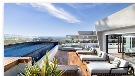
MARBELLA, MODERNES DESIGN MIT EDLEN MATERIALIEN, PENTHAUS, 5 SZ, 5 BD, 426 M 2 + 537 M 2 TER. EINZIGARTIGES KONZEPT CITYLAGE! PREIS A. ANFRAGE ID 181007