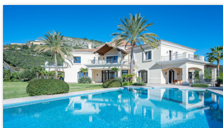
BENAHAVÍS, EXKLUSIVITÄT & ARCHITEKTONISCHE FINESSE, VILLA, 4 SZ, 4 BD, 780 M 2 + 155 M 2 TERRASS., 5008 M 2 , ERSTKLASSIGE FEATURES! € 5.490.000 ID 18562