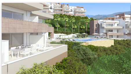
MIJAS-COSTA, TRENDSETTER MIT SORGFÄLTIG GESTALTETEM INTERIEUR! APARTMENT 2 SZ, 2 BD, 94 M 2 + 69 M 2 TER, CLUBHAUS NÄHE, ERSTBEZUG € 375.000 ID 18952