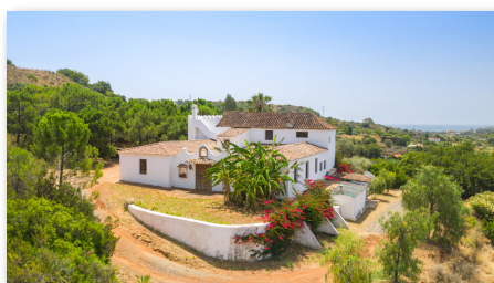
ESTEPONA, EXKLUSIVES LANDHAUS NAHE ZUR KÜSTE! 5 SZ, 4 BD, 480 M 2 , ≈ 26.000 M 2 , ÖKOLOG. HEIZSYSTEM, AUSBAUBARE ZONEN, POOL! € 2.250.000 ID 18855