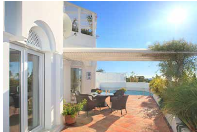
Ref 18278 ein Luxus-Apartment mit Privatpool und kompletter Astattung im modernsten Design auf Marbella's populärster Anhöhe um Euro 790.000

In allen Preisklassen sind beeindruckende Domizile zu erwerben U. a. sorgen Lagen direkt am Strand, verbunden mit einer soliden Bausubstanz für eine gute Wertanlage, die selbst genutzt wird, oder die später gewinnbringend verkauft werden kann. Vitalux Residencias bietet dabei eine feine Auswahl in verschiedensten Preisklassen an. Das Angebot richtet sich beispielweise an Interessenten für ein hochwertig saniertes Apartment an der Goldenen Meile Marbellas, über ein Luxus-Apartment mit Privatpool und kompletter Ausstattung im modernsten Design auf Marbellas populärster Anhöhe bis zu einem Palast in bester Stadtlage. Gesteigerter Wert wird auf die Auswahl von Immobilien al auch auf eine gute Beratung gelegt.